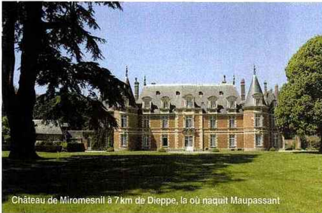
Château de Miromesnil à 7 km de Dieppe, la où naquit Maupassant

Unique en son genre, l'association Bienvenue au Château regroupe aujourd'hui plus de 140 propriétés privées réparties dans 10 régions de France. Créée il y a 25 ans, ce regroupement est né dans les Pays de la Loire, puis s'est développée dans le Grand Ouest de la France et s'est ouvert récemment à l'Île de France, l'Auvergne, la Bourgogne, l'Aquitaine et la Champagne Ardenne.