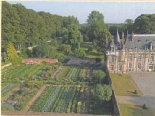
Vue imprenable sur le potager et le château.