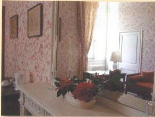
la chambre du capitaine