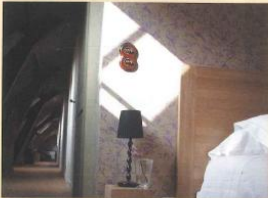
Ci-dessus et ci-dessous : Le gîte du château.